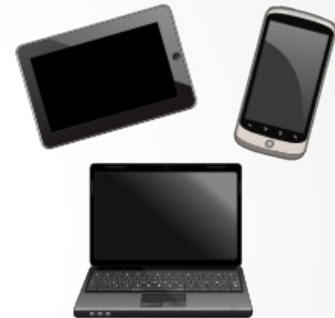
Linux / Windows / Mac / Android